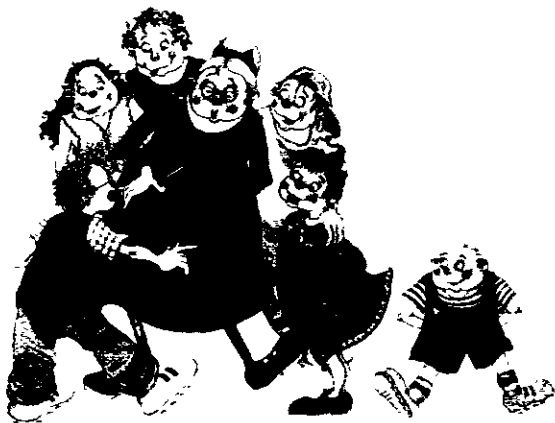
Ilustración de María Fe Quesada para Juegos de Maricastaña . Ed. Timun Mas