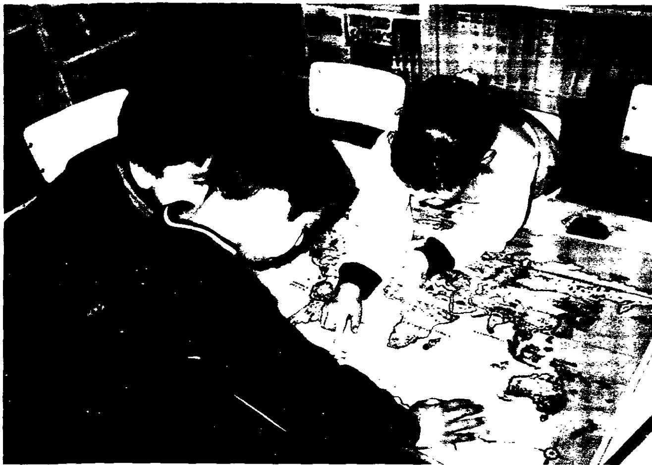
En el área de Sociales y con la ayuda del mapamundi, se localizaron y señalaron las zonas donde viven actualmente las ballenas.