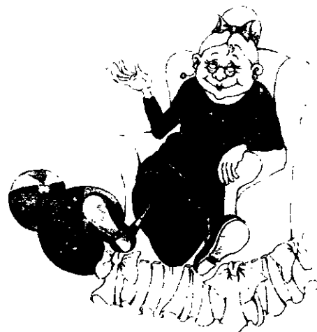
Ilustración de María Fe Quesada para Juegos de Maricastaña . Ed. Timun Mas.

La tercera fase se ha desarrollado en el tercer trimestre.