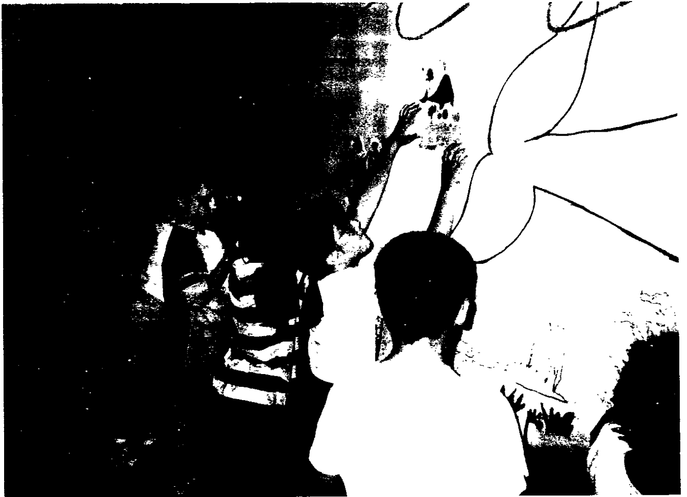
En la clase de Educación Plástica se elaboró el vestuario y los decorados necesarios para la ambientación y escenificación de la obra que se representó a fin de curso.

– A través de una técnica de animación a la lectura relacionada con poemas de ambiente marítimo y musical los profesores convertidos en animales, vegetales... se sintieron transportados al mundo marítimo y la biblioteca se convirtió en el más profundo de los océanos.